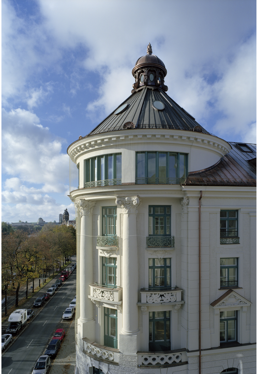
oben | Wiederhergestellter Eckturm