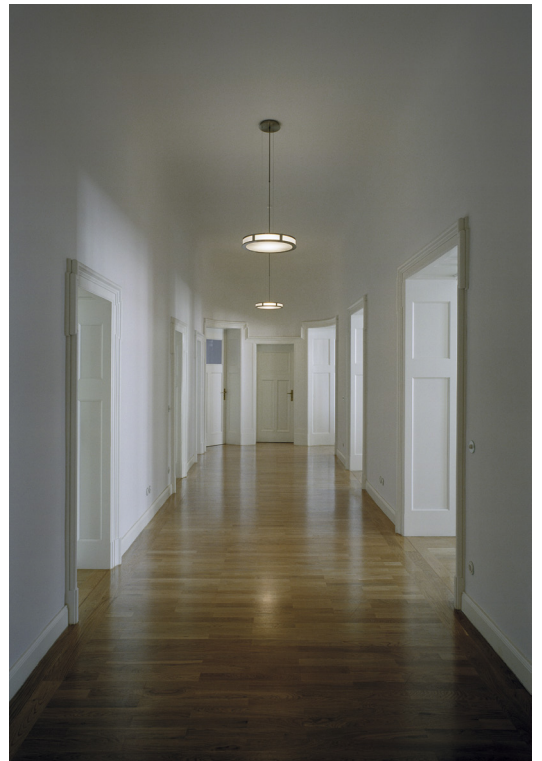
oben | sanierte Innenräume