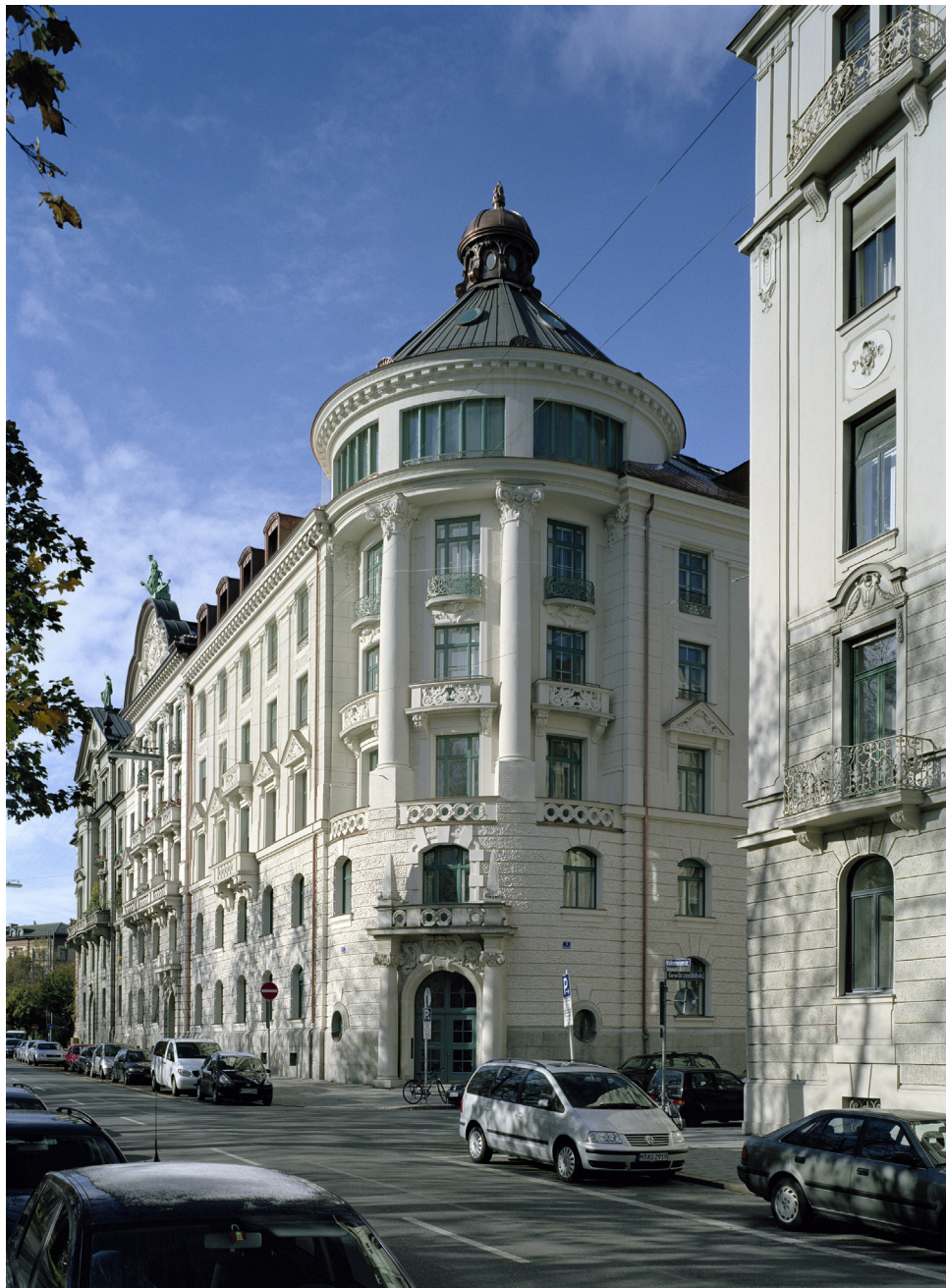
oben | Widenmayerstrasse

Sanierung und Umbau eines denkmalgeschützten Büro- und Geschäftshauses im Zentrum Münchens Realisierung 2003 - 2006 | Kosten 6 Mio. EUR | Größe 5.500 qm BGF | Auftraggeber KAN AM KG | Auszeichnung Fassadenpreis der Stadt München 2007