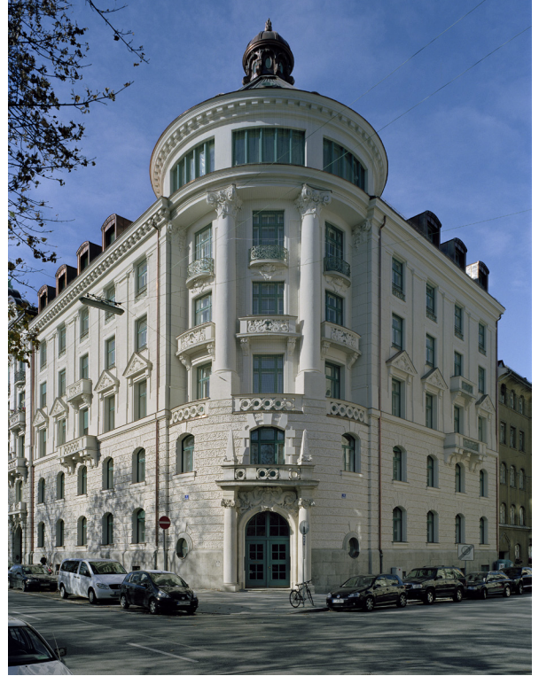
links | Zustand vor Sanierung rechts | nach Sanierung 2006