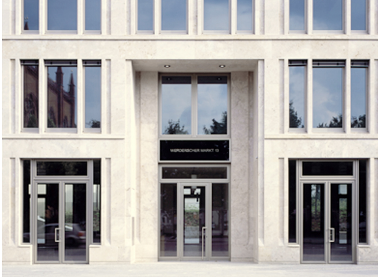
07 | Eingang Werderscher Markt