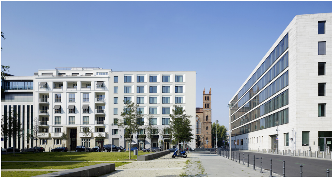
01 | Ansicht Jägerstraße

Neubau eines Büro- und Geschäftshauses sowie eines Apartment-Hotels am Werderschen Markt im Zentrum Berlins | Bieterverfahren 2006, 1. Preis | Realisierung 2006 - 2009 | Kosten 15 Mio. EUR | Größe 11.000 m 2 BGF | Auftraggeber Züblin AG