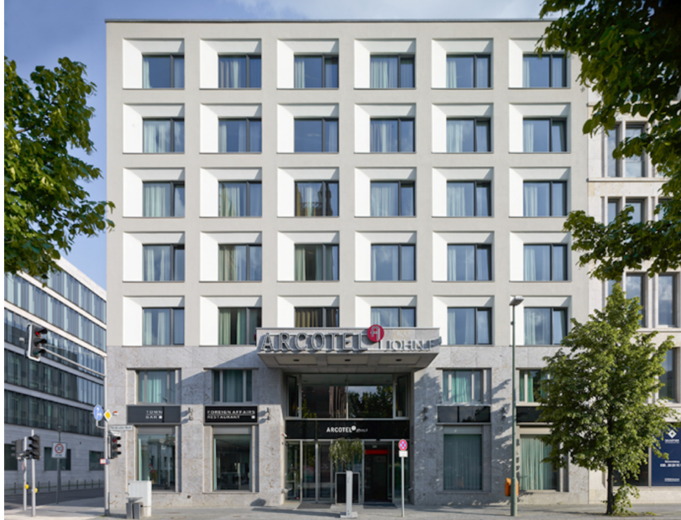
05 | Arcotel