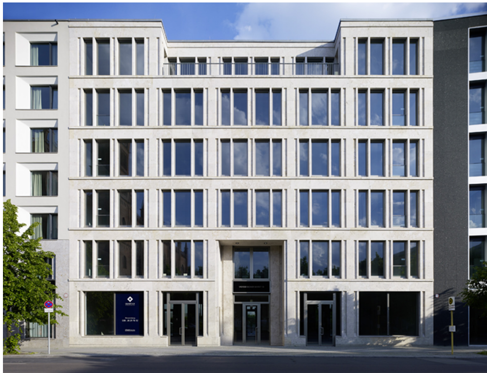
06 | Werderscher Markt 13