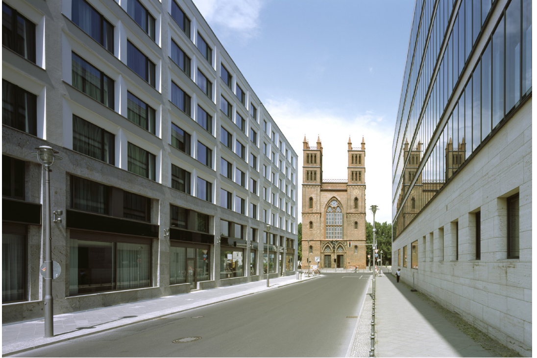
05 | Ausblick auf die Friedrichwerdersche Kirche 06 | Haupteingang Hotel