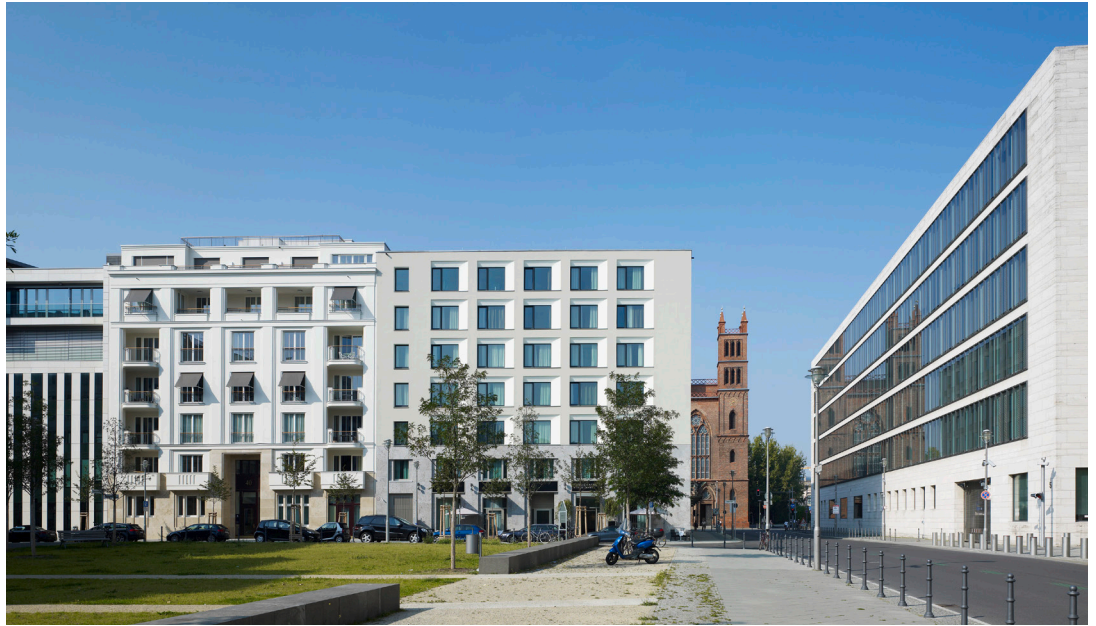
01 | Ansicht Arcotel Jägerstraße

Neubau eines 4-Sterne-Hotels am Werderschen Markt im Zentrum Berlins | Bieterverfahren 2006, 1. Preis | Realisierung 2006 - 2009 | Kosten 11 Mio. EUR | Größe 9.870 qm BGF | Auftraggeber Züblin AG