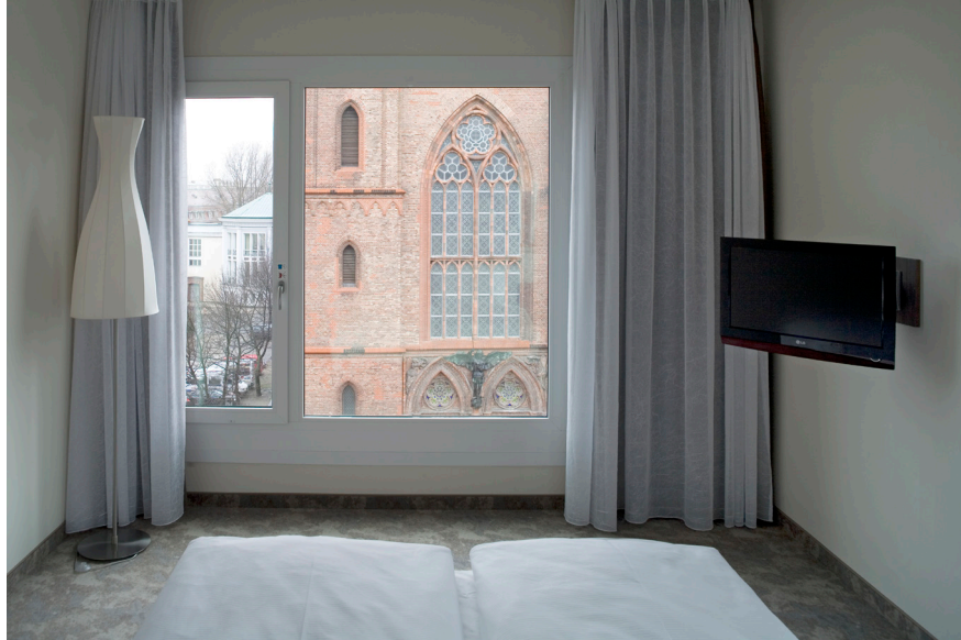
07 | Hotelzimmer