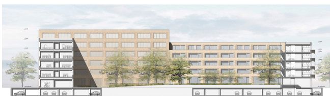
08 | Längsschnitt

vers. Die Fenster werden zu großformatigen Elementen zusammengefasst und vermitteln damit zu der Massstäblichkeit des Bürogebäudes. Mittels linearer Rücksprünge innerhalb des Verblendmauerwerkes werden die großformatigen Öffnungen asymmetrisch akzentuiert. Durch das geschossweise Versetzen dieser Struktur wird die Skulpturalität des Baukörpers betont. In Richtung des Grünzuges werden außerdem geschossweise versetzt auskragende Balkone angeordnet. Für das gesamte Gebäude ist eine Wohnnutzung mit insgesamt 89 Wohnungen vorgesehen. Es gliedert sich in 7 Bauteile mit separater Erschließung.