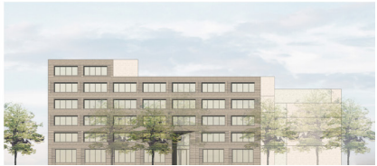
04 | Ansicht West