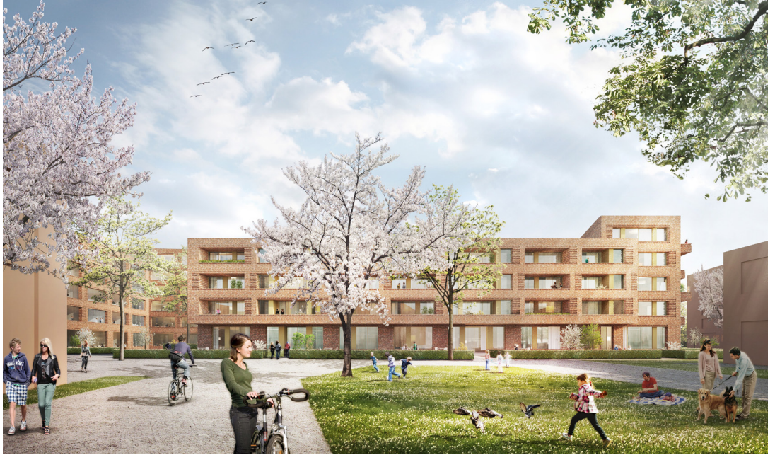
07 | Perspektive

Das 5-geschossige Gebäude mit Tiefgarage bildet mit der angrenzenden Bürobauung eine ruhige zusammenhängende Großform. Es stiftet damit Identität in einem heterogenen städtebaulichen Umfeld und bildet zugleich einen kraftvollen Auftakt für das südlich entstehende Wohnquartier. Die Gebäudefigur wird durch Höhenstufungen und einen Fassadenversprung im südlichen Gebäudeteil gegliedert. Die Wahl eines rötlichen Klinkers als Fassadenmaterial unterstreicht die selbstverständliche und selbstbewusste Situierung des Neubaus und verweist auf die Tradition dieses Materials in der Architektur Hanno-