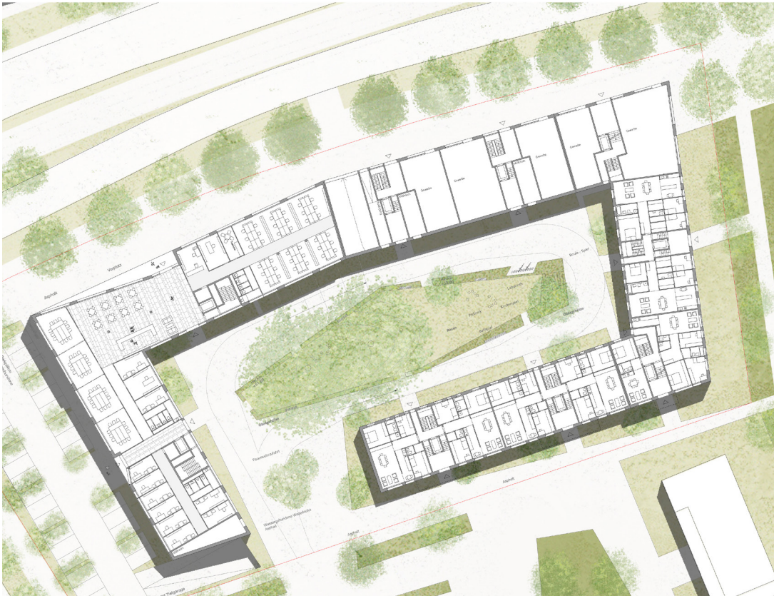
10 | Grundriss EG