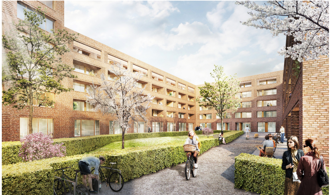
12 | Blick in den Hof