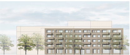
06 | Ansicht Ost