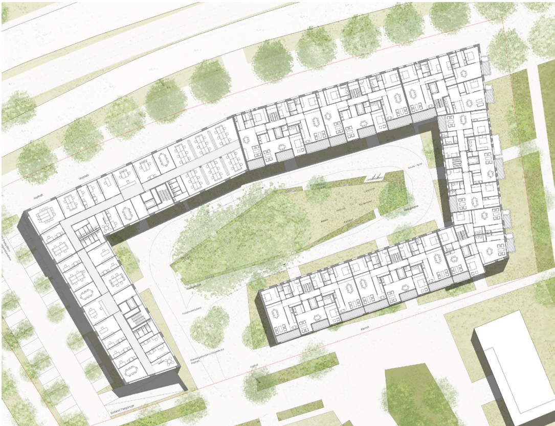
11 | Grundriss RG