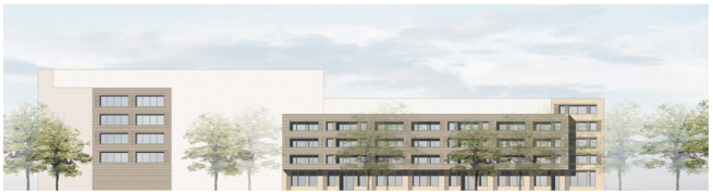
05 | Ansicht Süd