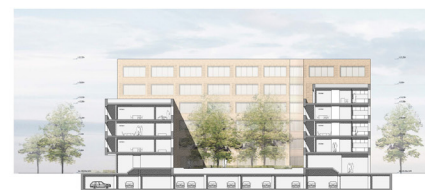
09 | Querschnitt