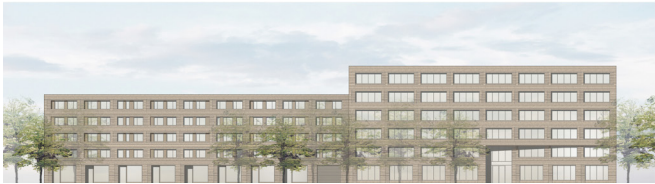
03 | Ansicht Nord