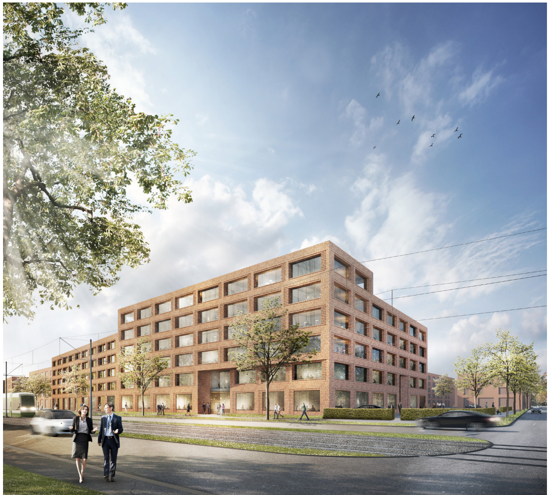
01 | Perspektive Podbielskistraße

Neubau eines Büro- und Wohngebäudes mit 89 Mietwohnungen und Gewerbeeinheiten in Hannover | Wettbewerb 2014, 1. Preis | Auftraggeber STRABAG Estate GmbH | Adresse Podbielski- straße, Ecke Pasteuralle, Hannover | Größe BGF 22.400 qm