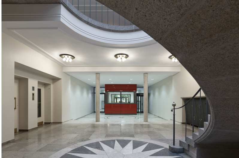
oben | Treppenhaus