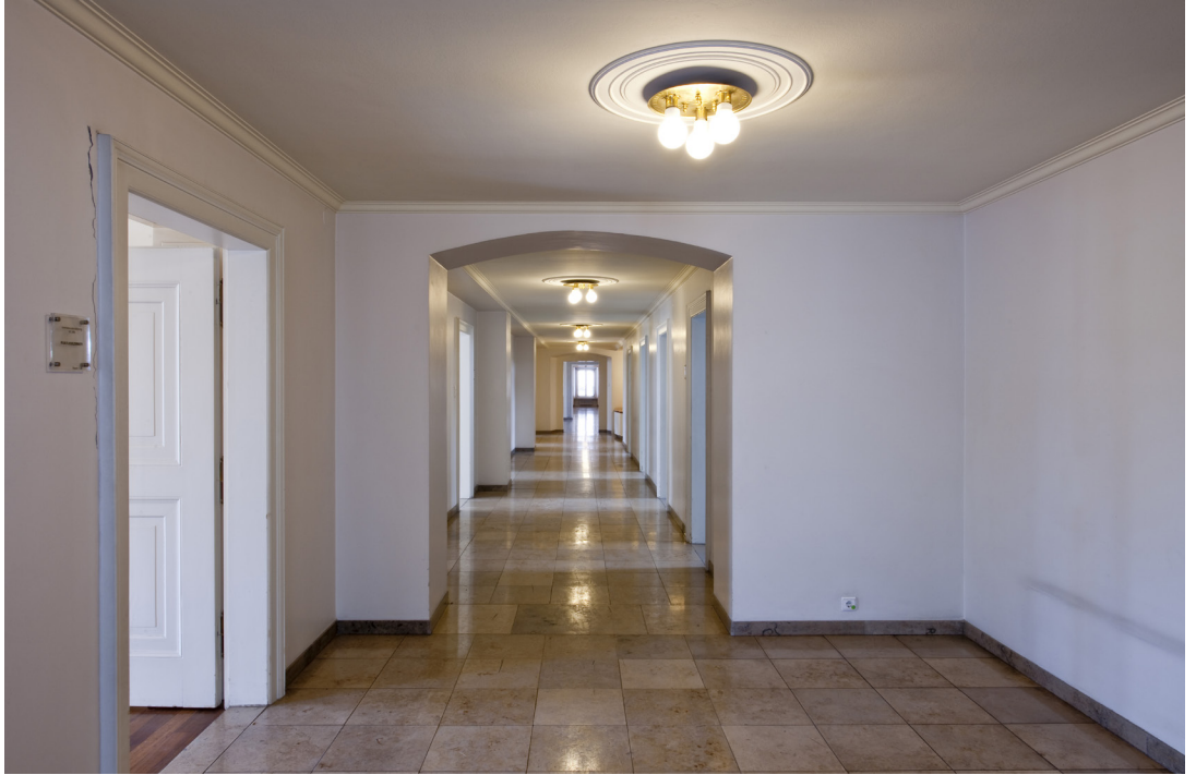
oben und unten | Flur und Büroräume