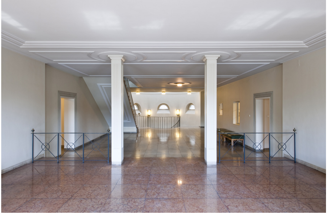
oben und unten | historisches Treppenhaus