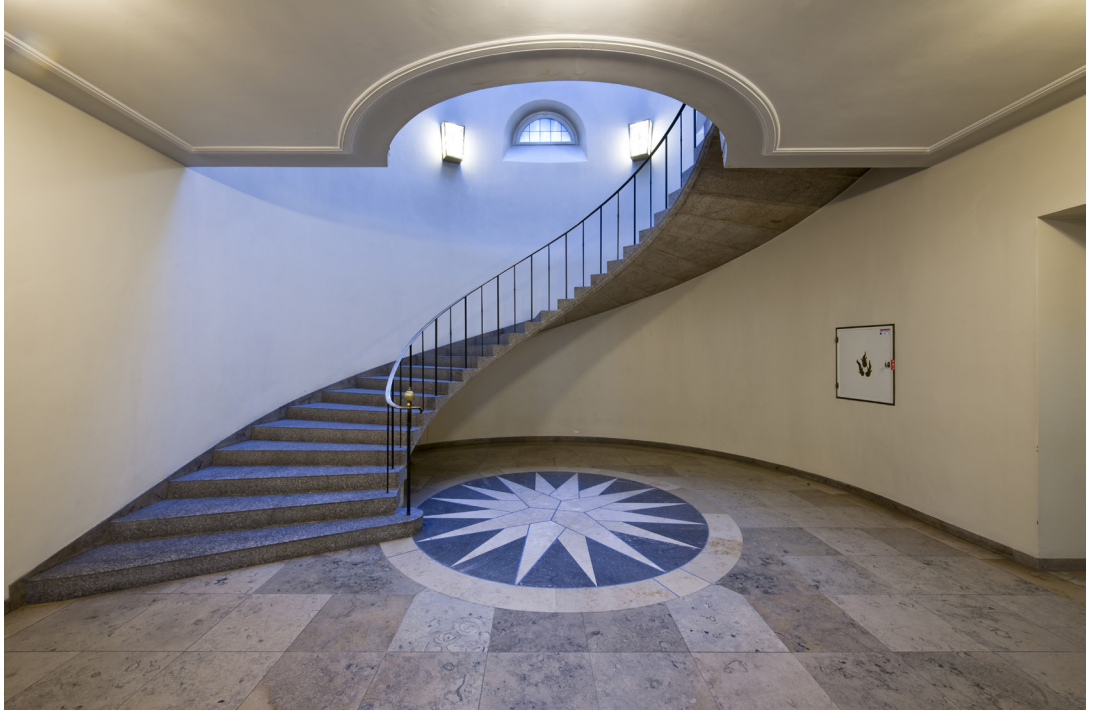
oben und unten | historisches Treppenhaus