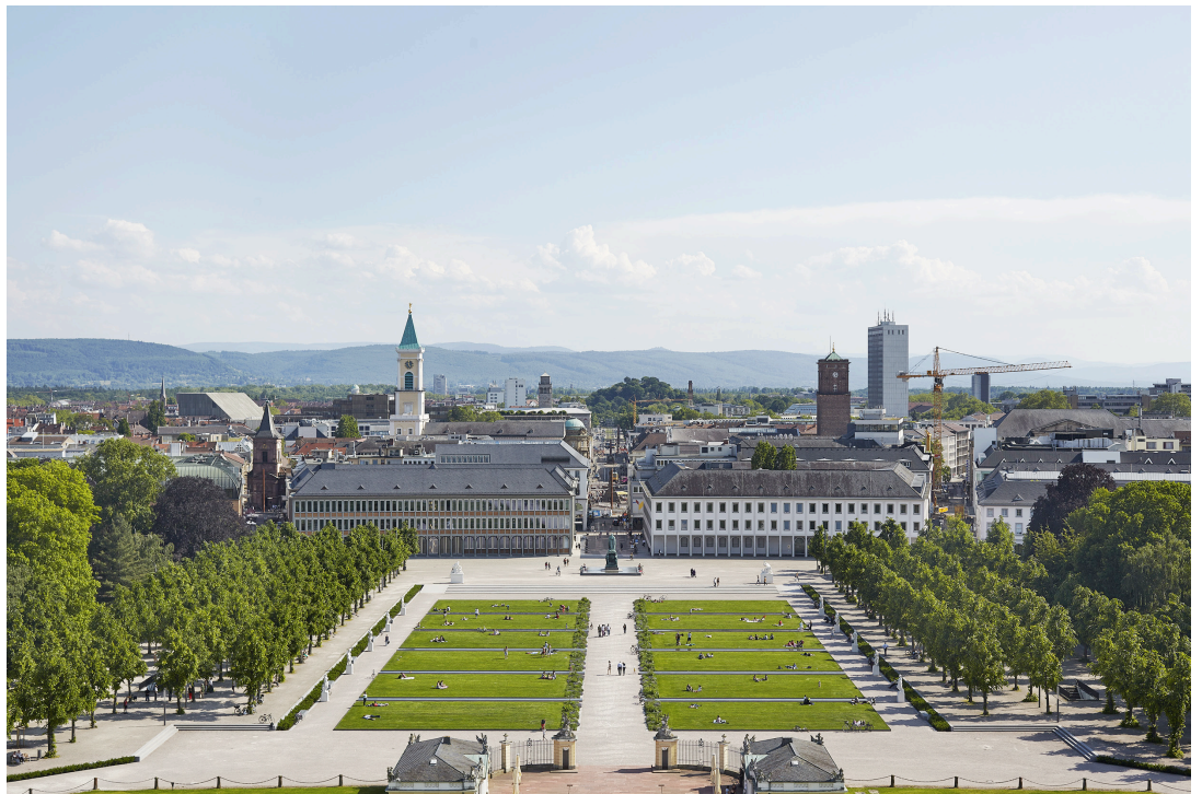
oben | Blick vom Schloss

Komplettsanierung des denkmalgeschützten Gebäudes von 1955 am Karlsruher Schlossplatz. Schadstoffsanierung und Austausch der kompletten Haustechnik. Wiederherstellung des ursprünglichen Erscheinungsbildes, Rückbau der Überdachung und Zurückverlegung des Haupteingangs an den Schlossplatz. Umplanung der Gebäudehülle zur energetische Ertüchtigung der denkmalgeschützten Fassade, Unterschreitung der EnEV 2009 | Gutachterverfahren 2008, 1. Preis | Realisierung 2008 - 2012 | Kosten 28,5 Mio. EUR | Größe 14.160 qm BGF | Auftraggeber Landeskreditbank Baden-Württemberg