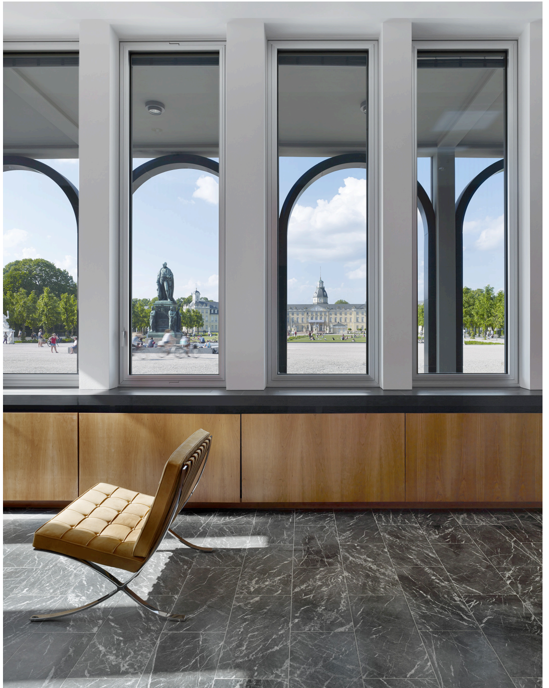
oben | Lobby