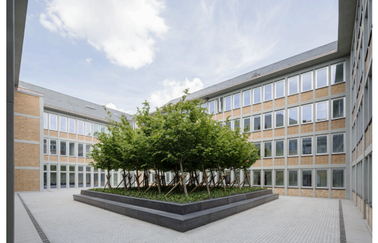
oben | Nordhof vor und nach Sanierung