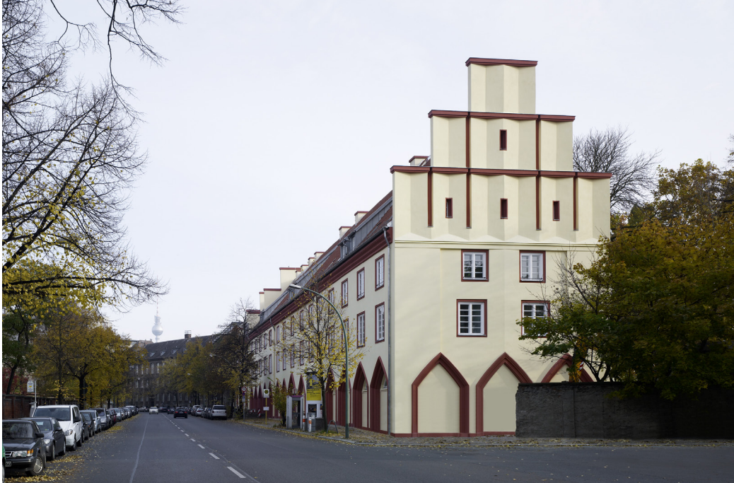
06 | Ansicht Philipstraße