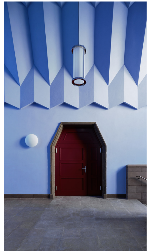
09 | Zugang zum Hörsaal