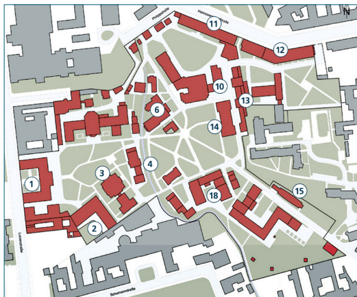
Lageplan Campus Lebenswissenschaften

Das unter Denkmalschutz stehende Bauwerk der ehemaligen Pferdeklinik gilt als bemerkenswertes Beispiel des späten Expressionismus. Es wurde 1926 zur Nutzung als Chirurgische Pferdeklinik nach dem Entwurf des Architekten Walter Wolff im Zuge einer Neuplanung des Geländes der Tierärztlichen Hochschule errichtet. Das Haus übernahm mehrere Funktionen unter einem Dach: Forschung und Lehre, Stall, Futterspeicher und OP. Umbau und Sanierung des Gebäudes erfolgten zur Unterbringung von Labor- und Büroräumen und einer Sporthalle für das Zentrum der Sportwissenschaft und Sportmedizin der Humboldt-Universität zu Berlin. Besondere Aufmerksamkeit galt der größtmöglichen Wahrung des ursprünglichen Bestands und der teilweisen Rekonstruktion historischer Befunde in Abstimmung mit den Belangen des Denkmalschutzes.