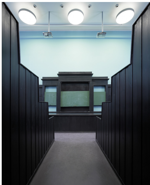
10 | Hörsaal