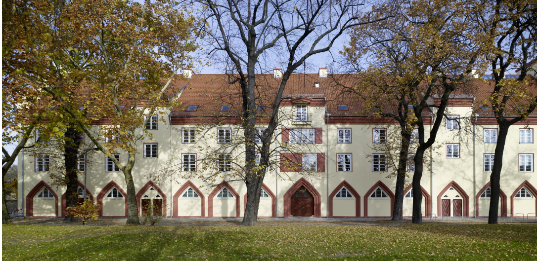
02 | Institut für Sportwissenschaft mit Sportmedizin – Ansicht Campus

Das denkmalgeschützte Ensemble der ehemaligen Veterinärmedizinischen Fakultät der Humboldt-Universität zu Berlin entstand im Lauf der letzten 200 Jahre. 1798 wurde mit dem Bau des Anatomischen Theaters von Carl Gustav Langhans die königliche Tierarzneischule begründet. Das Gelände erfuhr immer wieder bauliche Erweiterungen und wurde schließlich 1934 der Humboldt-Universität angegliedert. Die weitläufige Anlage liegt im Zentrum Berlins in unmittelbarer Nähe der Charité. Es besteht aus einer Reihe einzelner Gebäude, die in einem ursprünglich von Peter Joseph Lenné gestalteten Park eingebettet sind. Die seit dem Krieg vernachlässigten Bestandsgebäude werden stufenweise denkmalgerecht saniert, umgebaut und an die Bedürfnisse moderner Forschung und Lehre angepasst. Seit 1994 wurden zehn Objekte saniert und ein Neubau in die bestehende Parkanlage integriert.