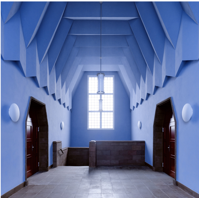
08 | Vorraum mit rekonstruiertem Fächergewölbe